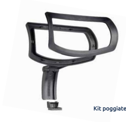
Kit poggiatesta per rete

Se anche per te semplicità non è sinonimo di banalità, se ricerchi la pulizia delle forme e fai del minimal design la tua ragione di vita: Melania è la sedia che fa per te. Melania è la scelta perfetta per qualsiasi ambiente vorrai creare per il tuo ufficio.