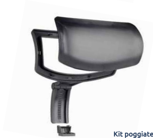
Kit poggiatesta con pannello da tapezzare