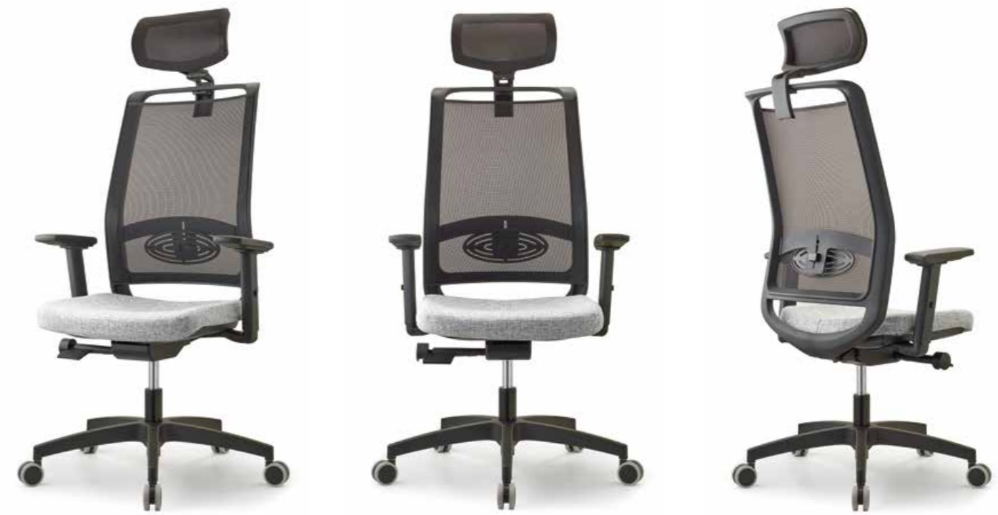
Giulietta Design by_ Ivars