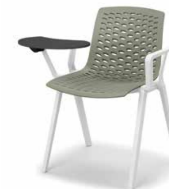
Versione con tavoletta