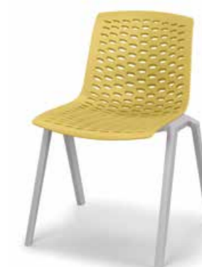
Versione senza braccioli

La nostra proposta prevede: due tonalità di grigio e una di bianco, per la struttura del telaio in plastica con la possibilità di personalizzarla con eventuali braccioli. Sono ben 6 i colori a disposizione per la scelta dell'esclusiva scocca in plastica.