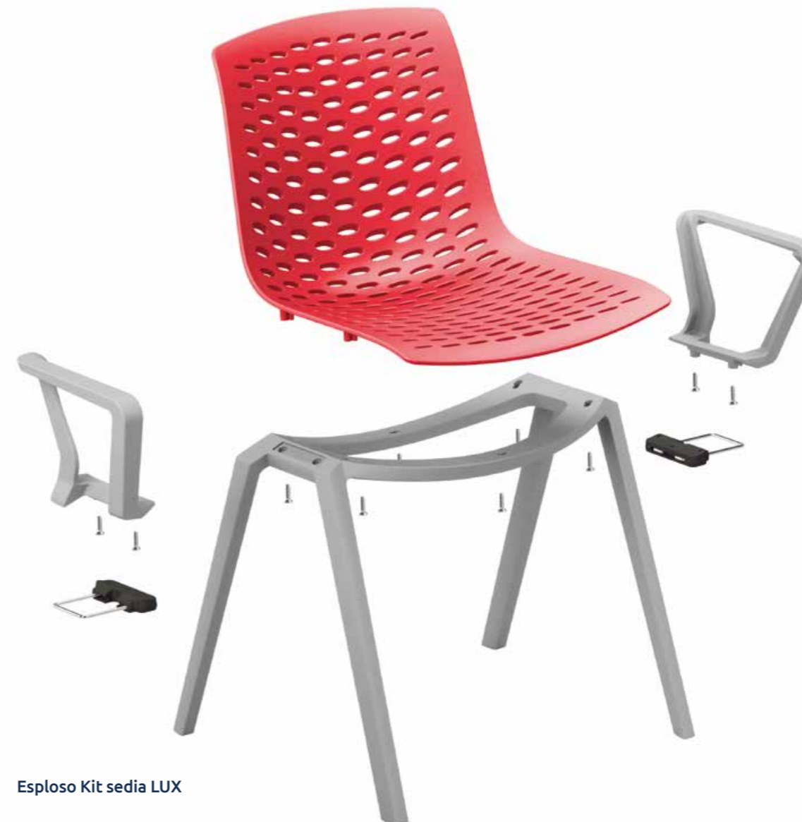
Esploso Kit sedia LUX