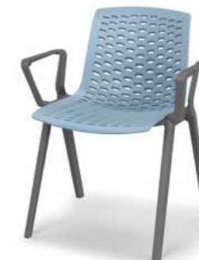
Versione con braccioli